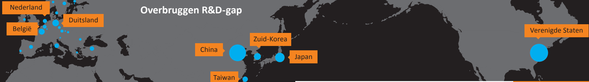
Totale R&D investeringen in miljoenen dollars (PPP)